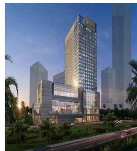
厦门香格里拉大酒店