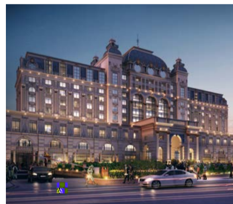
朝阳合生财富广场