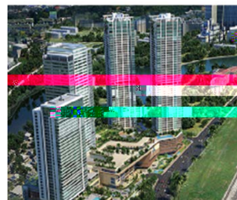
斯里兰卡科伦坡香格里拉项目