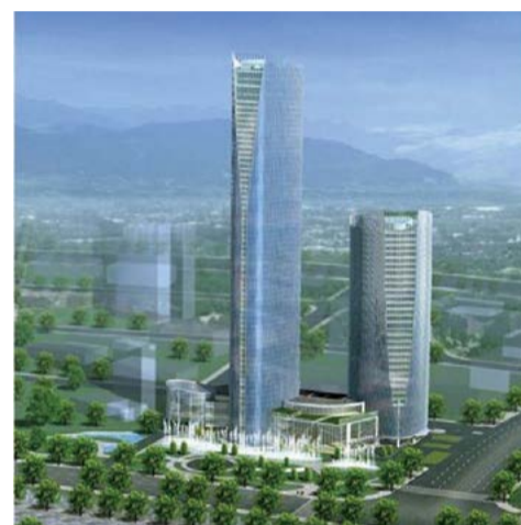
南昌香格里拉大酒店