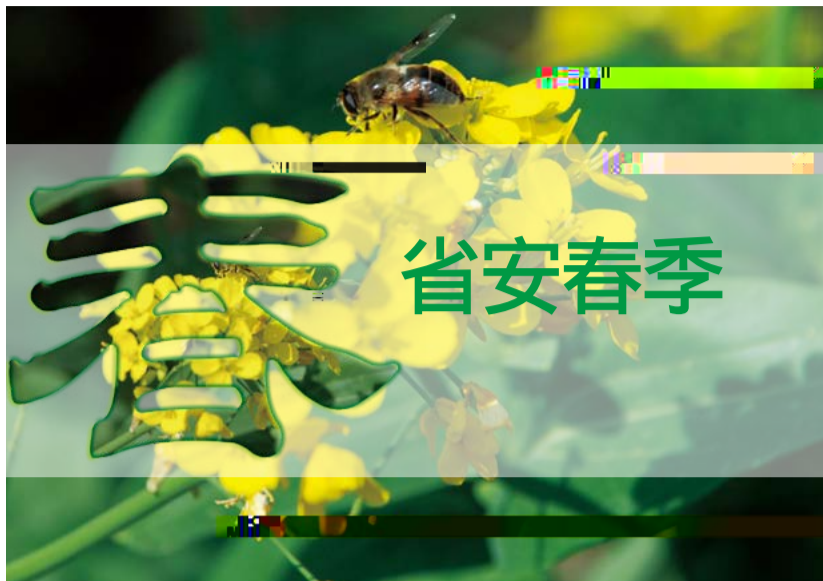
蜂点菜花香 - 赵军