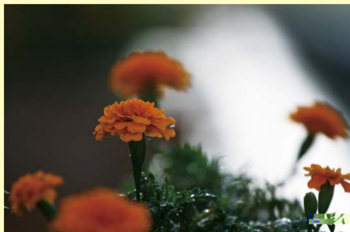
雨露 - 孟娟