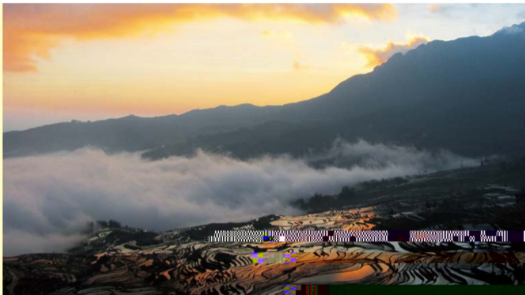
元阳晨曦 - 方忠庆