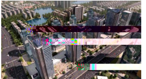
南京长江航运中心项目