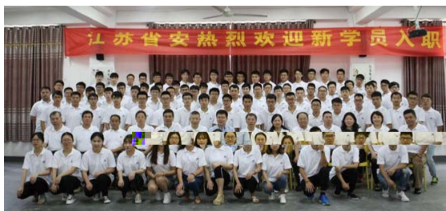
图为公司领导、总部部门负责人与新员工合影