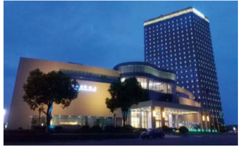
扬州锦诚国际饭店项目