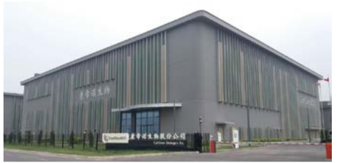
天津康希诺生物工厂项目