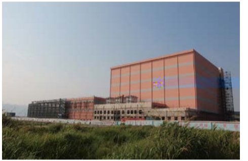
浙江省象山水产中心冷库项目